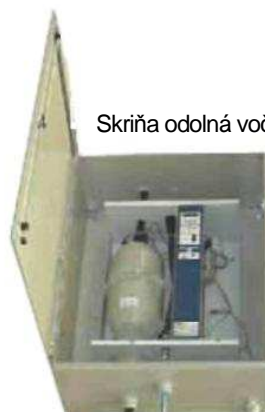
Skriňa odolná voči počasiu