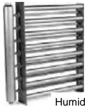
Humidipack pre krátke miešacie dĺžky

* pre capacity nad 90 kg/h, prosím kontaktujte výrobcu