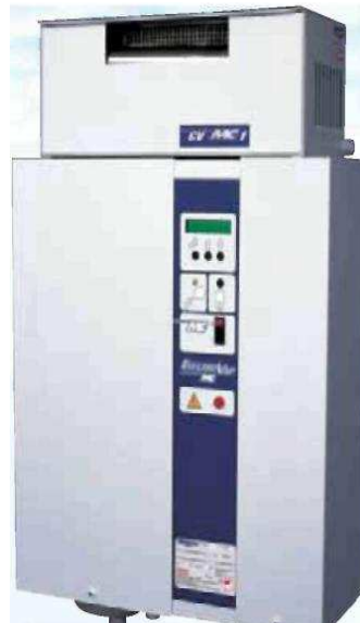
ELMC 5 s ventilačnou jednotkou