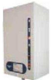
ElectroVap CMC kompaktný typ zvlhčovača