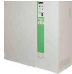
ElectroVap RTH s vykurovacími prvkami