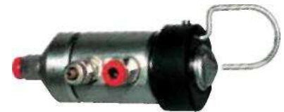
Zahmlievací systém BUS/BV